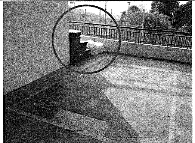
公眾地方放有膠箱及雜物

信和物業管理有限公司 Sino Estates Management Limited